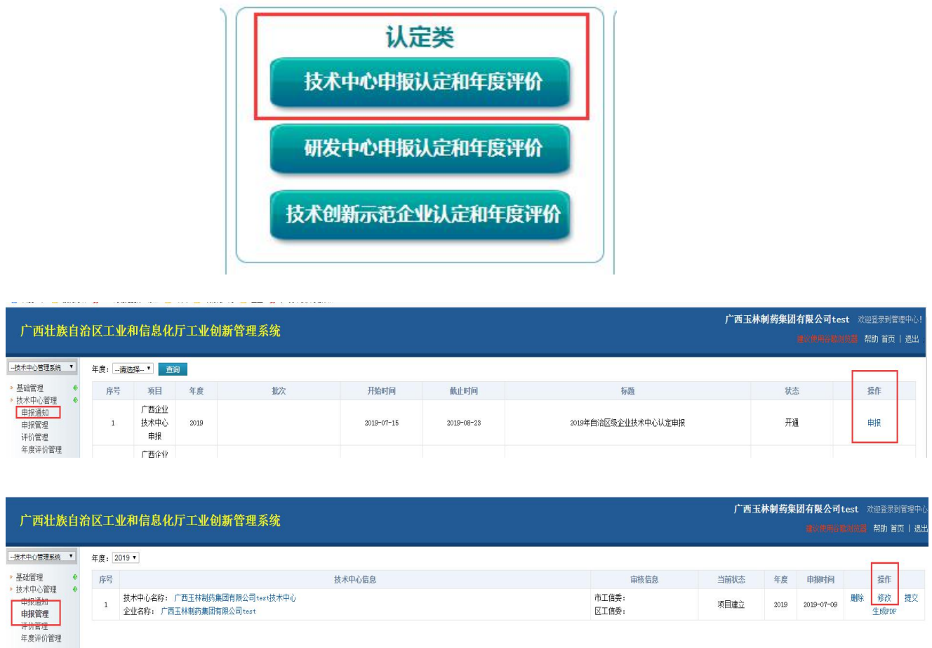
图 3 技术中心认定申报

企业登录系统后，进入“认定类-技术中心申报认定和年度评价”子系统，点系统左侧“申报通知”，可见当年申报内容，点右侧操作下方的“申报”即可进入申报，请按要求填写申报材料并上传相应附件。填写过程中请注意保存。 注意，左侧“申报通知”只能点一次，第二次进入系统修改完善材料请点左侧“申报管理”，不可再点“申报通知”，以免重复多次申报同一项目。