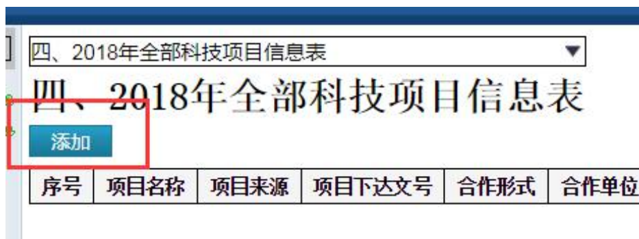
图 5 点击“添加”按钮填写材料